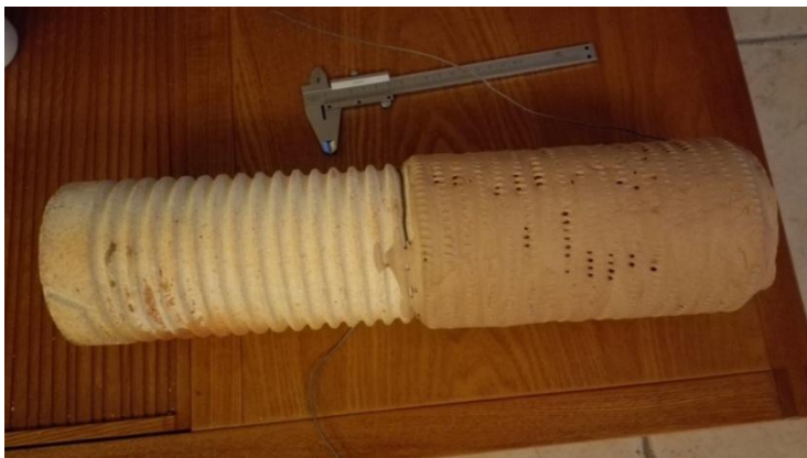
图 2，缠绕电阻丝的加热器

加热器是用电阻丝缠绕在一根瓷管上，功率 2000w，加热段长度 200mm，电阻丝外表涂抹耐火水泥，瓷管长度 430mm，瓷管内径 80mm。加热器安装在一个保温壳体内，保温材料是氧化铝纤维和莫来石，保温材料安装于一个不锈钢壳内，不锈钢壳直径 500mm 长 600mm