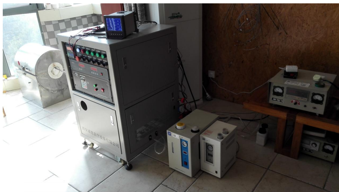
图 6，加热器与容器和真空系统、氢气发生器连接就位