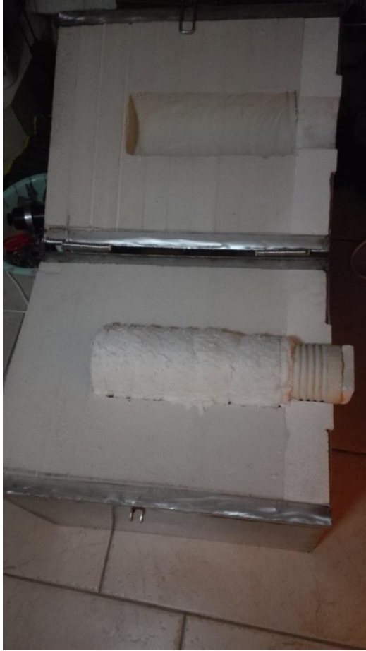
图 3，加热器安装在保温壳内