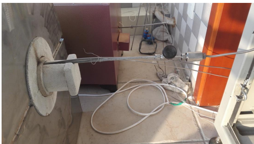
图 5，容器安装于加热管内，测压管与真空设备连接，热电偶引出